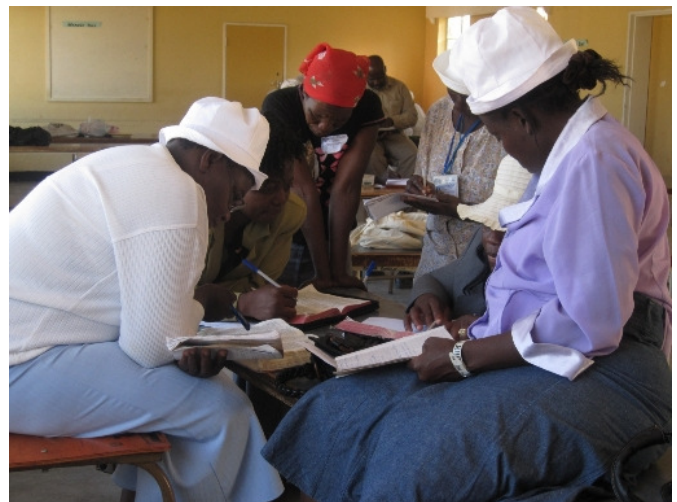
Bibelarbeit zu Psalm 85