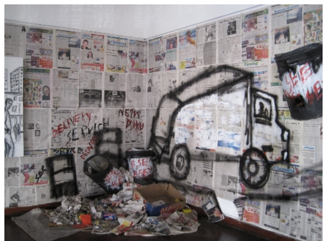
Installation in der National Gallery