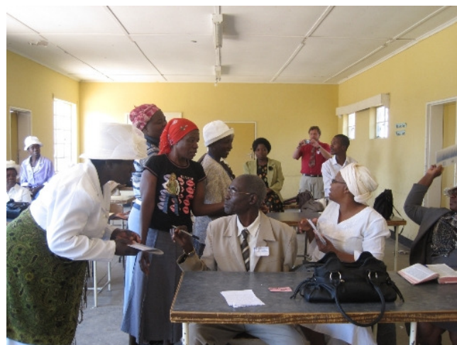
Aufteilung der letzten Exemplare der VDM-Friedenserklärung